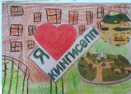
Рисунок Шевелевой Елены